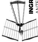
INGRESSO 1 ANTENNA HYDRA45LTE